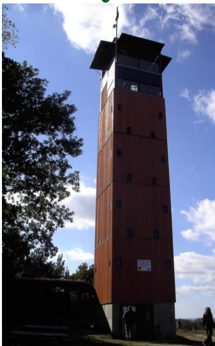
Rozhledna Vladimíra Menšíka