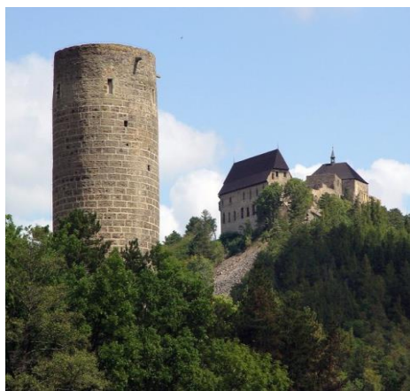
Točník a Žebrák